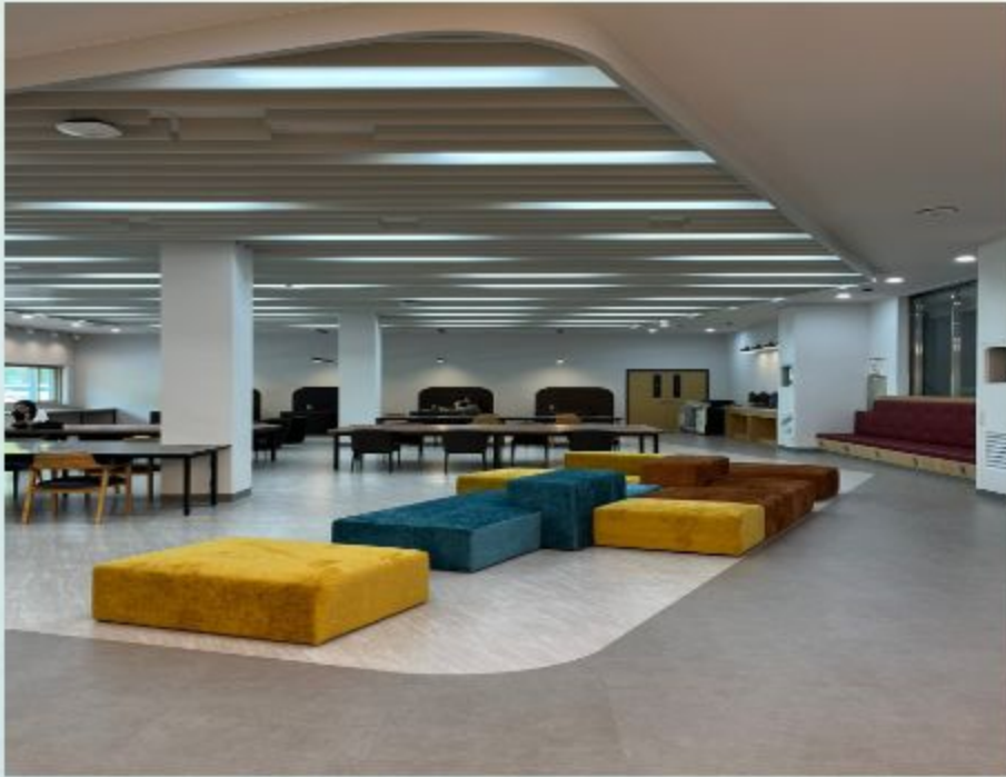
도 서 관